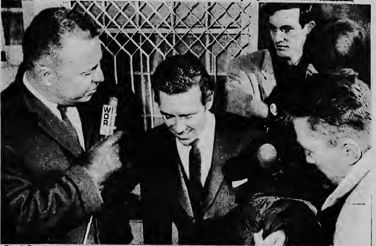
Lord Snowdon a ser rondona door di periodistanan ora qu el a bandona su hotel ayera na New York pa bal discuti un asunto di negoshi cu un revista ayera. El a nenga di contesta e preguntanan riba rumornan di qu su matrimonio di Prinses Margaret ta den dificultad.

un haaf grandi qu tabata ser utiliza como e base principal di e septimo flota norteamericano promer qu e comunistanan a ocupa henter China Continental.